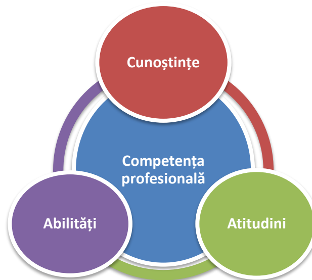
Fig. 1. Dezvoltarea competențelor profesionale prin punerea în practică a cunoștințelor, abilităților și atitudinilor deprinse în procesul de învățare teoretică și practică.

Scopul existenței competențelor profesionale în domeniul îngrijirilor paliative este acela de a dota – prin metode de formare teoretice, practice și de auto-conștientizare, asistenții medicali să acorde îngrijiri paliative de calitate, pe tot parcursul evoluției bolii cronice progresive a pacientului, până la deces, și familiei acestuia.